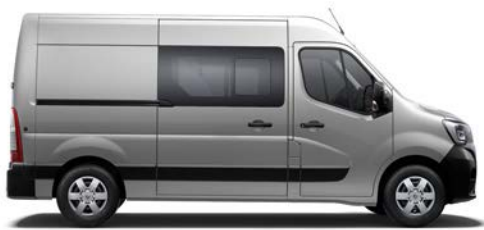
Brigādes furgons ar dubltkabīni (FWD, RWD*)