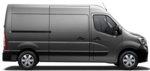
Furgons (FWD, RWD, 4x4 *)

Tev ir plašs dažādu vajadzību klāsts, ko spēj apmierināt plašais jaunā Renault MASTER salona aprīkojuma, garuma, augstuma, motoru un izvēļu klāsts.