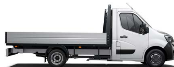
Kravas kaste ar atvāzamu bortu