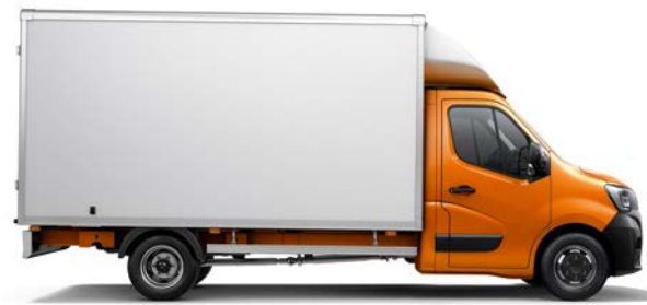
Kravas furgons (FWD, RWD*)

* FWD - priekšējā piedziņa RWD - aizmugurējā piedziņa (aizmugurējie monoriteņi vai dubultriteņi) 4x4 - 4x4 piedziņa (monoriteņi vai aizmugurējie dubultriteņi)